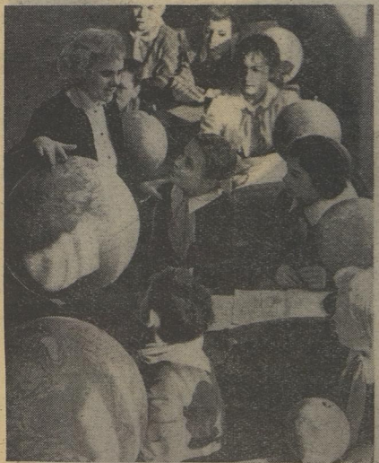
ВЕДЁТ ПО МЕРИДИАНАМ И ПАРАЛЛЕЛЯМ ВСЕЙ ПЛАНЕТЫ,