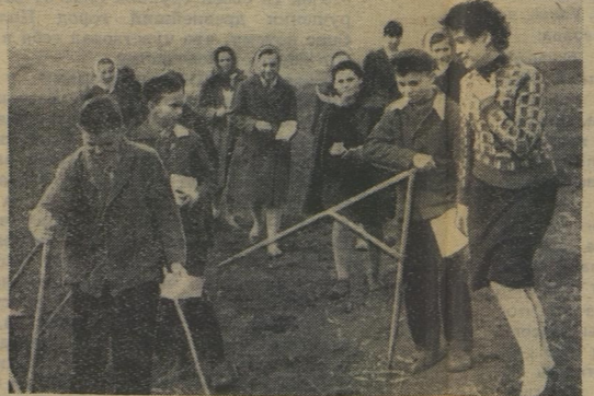
УЧИТ ПО-ХОЗЯЙСКИ РАСПОРЯЖАТЬСЯ РОДНОЙ ЗЕМЛЁЙ,